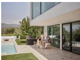
Immagine 5: "Dreams" consente alla clientela di realizzare la propria cucina da esterno personalizzata dei sogni. La prima cucina da esterno di Miele è stata creata in collaborazione con Otto Wilde Grillers, un'azienda specializzata in barbecue che Miele ha acquisito nel 2023. (Immagine: Miele)

Immagine 4: L'intera gamma della prima cucina da esterno Miele è realizzata con materiali di alta qualità, adatti all'uso outdoor e in grado di resistere al sole o alla pioggia 365 giorni all'anno. Grazie al suo design minimalista, la cucina si inserisce come highlight in qualsiasi spazio esterno. (Immagine: Miele)