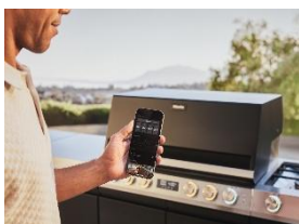
Immagine 9: Per la prima volta, il barbecue può essere controllato anche a distanza tramite l'app Miele@mobile collegata* o i parametri delle ricette CookAssist appositamente sviluppate possono essere inviati al barbecue. Così, la clientela può approfittare della grigliata con i propri ospiti invece di rimanere davanti al barbecue. (Immagine: Miele)

Immagine 8: Il barbecue a gas intelligente "Fire Pro IQ" permette di grigliare e cuocere con la massima precisione. Premendo un pulsante, si riscalda fino a raggiungere la temperatura desiderata in pochi minuti e regola il calore delle quattro zone di cottura in modo indipendente, proprio come un forno. (Immagine: Miele)