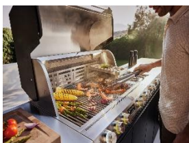
Immagine 7: Per fugare ogni dubbio sul fatto che uno o più bruciatori siano accesi anche in condizioni atmosferiche avverse, una speciale spia luminosa ne indica lo stato: giallo per acceso, bianco per spento. (Immagine: Miele)

Immagine 6: In qualità di produttore di elettrodomestici di alta gamma, Miele è da oltre 126 anni sinonimo di qualità, design di alta qualità, semplicità di utilizzo e funzioni innovative. Con la nuova categoria di prodotti "Outdoor Cooking", l'azienda trasferisce ora questo know-how all'esterno. (Immagine: Miele)