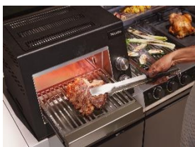
Immagine 6: In qualità di produttore di elettrodomestici di alta gamma, Miele è da oltre 126 anni sinonimo di qualità, design di alta qualità, semplicità di utilizzo e funzioni innovative. Con la nuova categoria di prodotti "Outdoor Cooking", l'azienda trasferisce ora questo know-how all'esterno. (Immagine: Miele)

Immagine 5: "Dreams" consente alla clientela di realizzare la propria cucina da esterno personalizzata dei sogni. La prima cucina da esterno di Miele è stata creata in collaborazione con Otto Wilde Grillers, un'azienda specializzata in barbecue che Miele ha acquisito nel 2023. (Immagine: Miele)