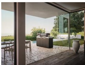
Immagine 4: L'intera gamma della prima cucina da esterno Miele è realizzata con materiali di alta qualità, adatti all'uso outdoor e in grado di resistere al sole o alla pioggia 365 giorni all'anno. Grazie al suo design minimalista, la cucina si inserisce come highlight in qualsiasi spazio esterno.