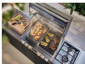
Immagine 3: Una combinazione perfetta di griglia e accessori: utilizzate la superficie modulare delle griglie di Fire Pro e Fire Pro IQ in modo nuovo, con l'aiuto di vari accessori in acciaio inossidabile e ghisa. (Immagine: Miele)

Immagine 2: Con i suoi cinque sensori nel vano cottura e sulla griglia, il Fire Pro IQ regola le temperature in modo più preciso di qualsiasi altro barbecue. Per un comfort ancora maggiore, basta selezionare un programma automatico nell'app Miele@mobile, inviarlo al Fire Pro IQ e farsi guidare passo dopo passo verso il risultato perfetto. (Immagine: Miele)