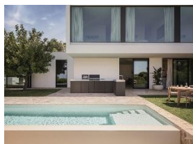
Immagine 1: Tutti i moduli della cucina da esterno Miele possono essere combinati in modo flessibile tra loro - per configurazioni piccole e grandi, in giardino, sulla terrazza o sul balcone.