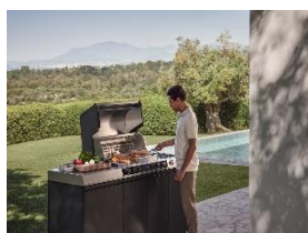
Immagine 2: Con i suoi cinque sensori nel vano cottura e sulla griglia, il Fire Pro IQ regola le temperature in modo più preciso di qualsiasi altro barbecue. Per un comfort ancora maggiore, basta selezionare un programma automatico nell'app Miele@mobile, inviarlo al Fire Pro IQ e farsi guidare passo dopo passo verso il risultato perfetto. (Immagine: Miele)

Immagine 1: Tutti i moduli della cucina da esterno Miele possono essere combinati in modo flessibile tra loro - per configurazioni piccole e grandi, in giardino, sulla terrazza o sul balcone. (Immagine: Miele)