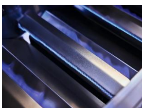
Immagine 8: Il barbecue a gas intelligente "Fire Pro IQ" permette di grigliare e cuocere con la massima precisione. Premendo un pulsante, si riscalda fino a raggiungere la temperatura desiderata in pochi minuti e regola il calore delle quattro zone di cottura in modo indipendente, proprio come un forno. (Immagine: Miele)

Immagine 7: Per fugare ogni dubbio sul fatto che uno o più bruciatori siano accesi anche in condizioni atmosferiche avverse, una speciale spia luminosa ne indica lo stato: giallo per acceso, bianco per spento. (Immagine: Miele)